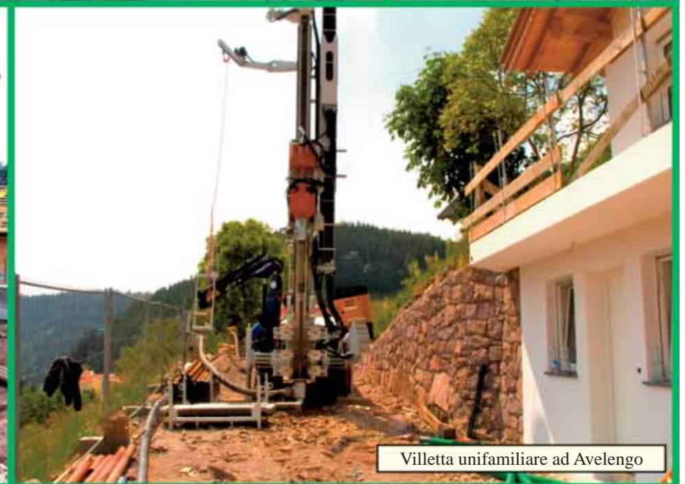
Villetta unifamiliare ad Avelengo