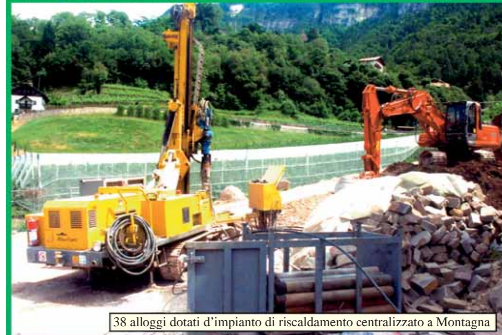
38 alloggi dotati d'impianto di riscaldamento centralizzato a Montagna