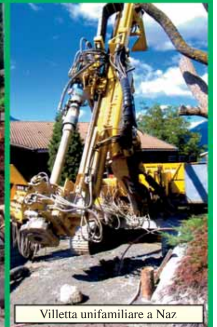
Villetta unifamiliare a Naz