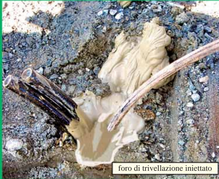
foro di trivellazione iniettato